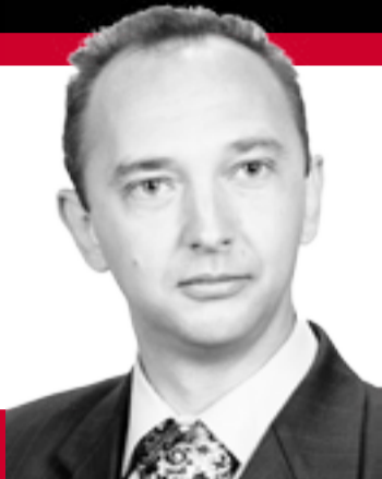
Руслан КРАМАР голова фракції «Батьківщина»