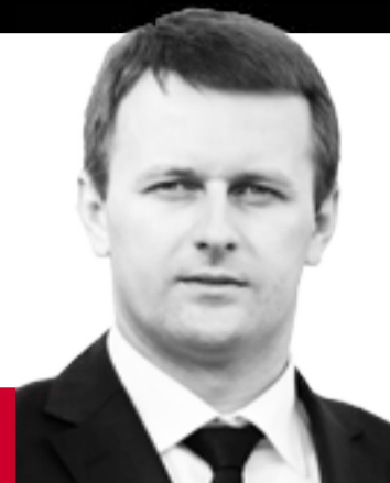
Богдан ГАБШІЙ голова фракції «Свобода»